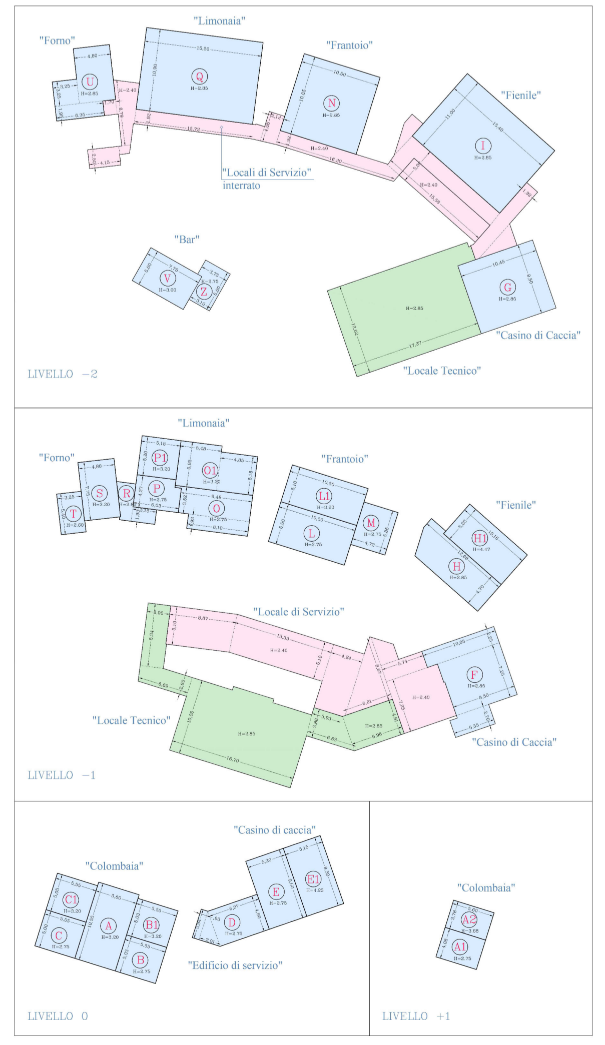
SCHEMA DI CALCOLO SUL E VOLUMI