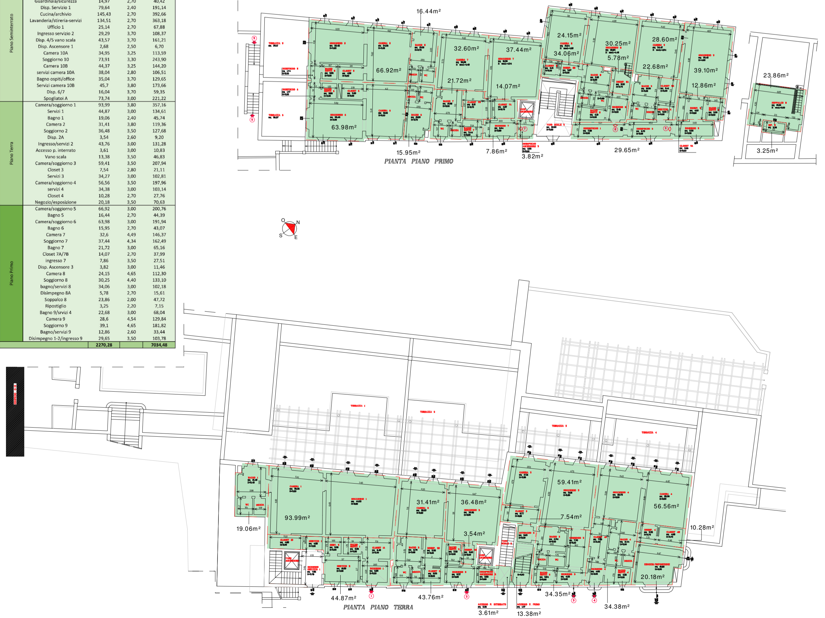
IMMOBILE B - EX UFFICI