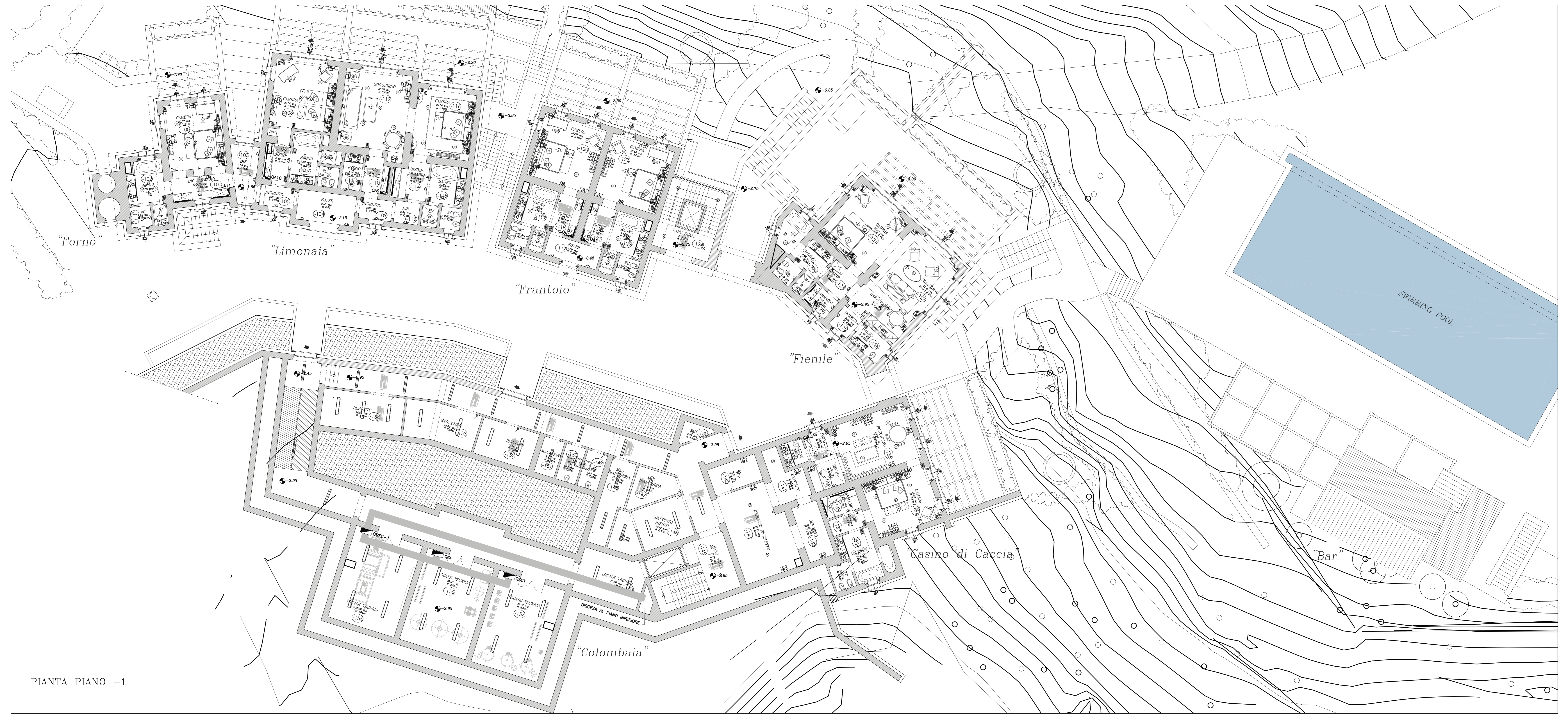
PIANTA PIANO -1