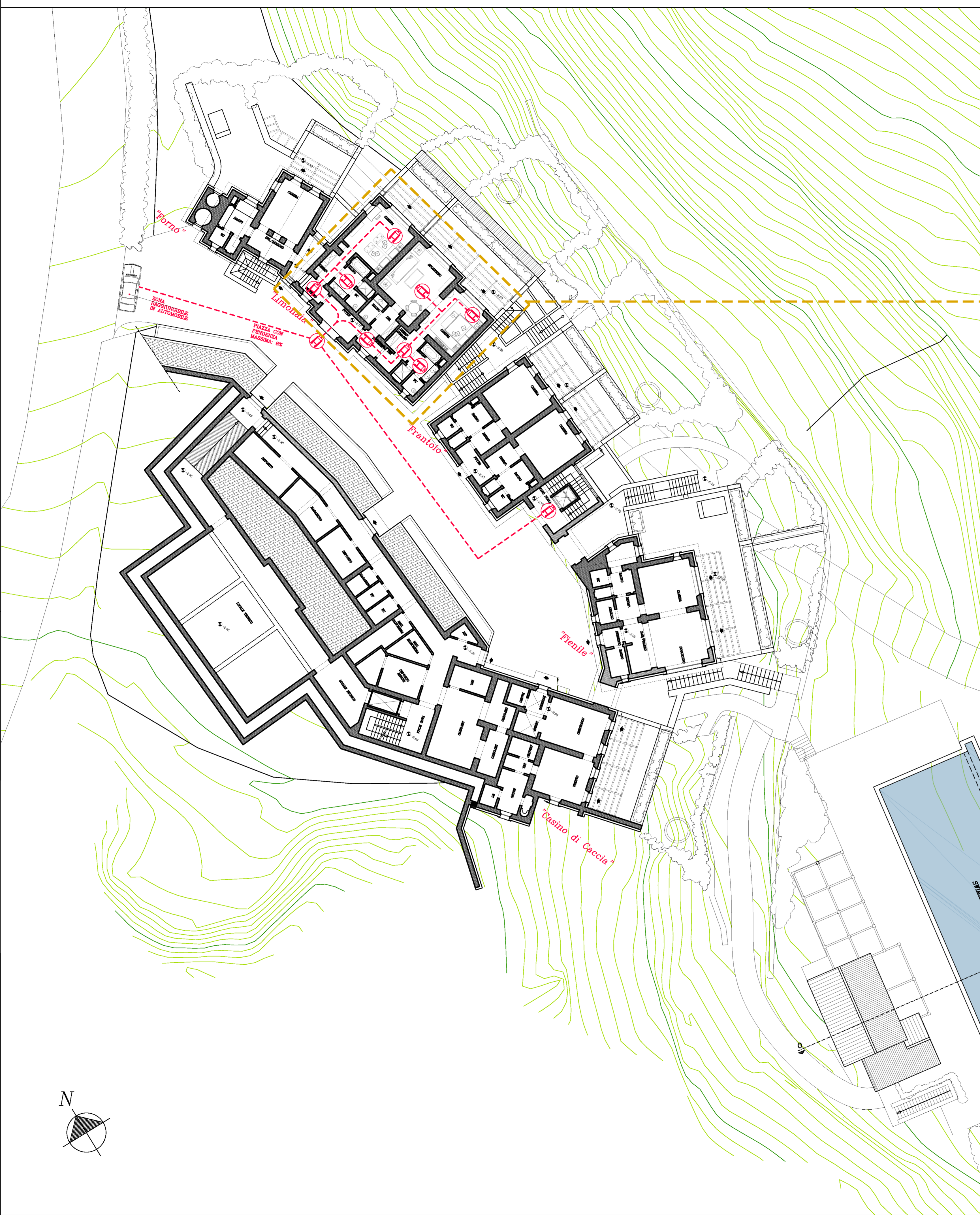
CAMERA E SUITE ACCESSIBILI Scala 1:100

Firma del legale rappresentante Firma del Progettista